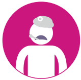
Colds, flu & fevers

With telehealth services, you can make an appointment for a time that works with your schedule. You can receive medical help for illnesses such as: